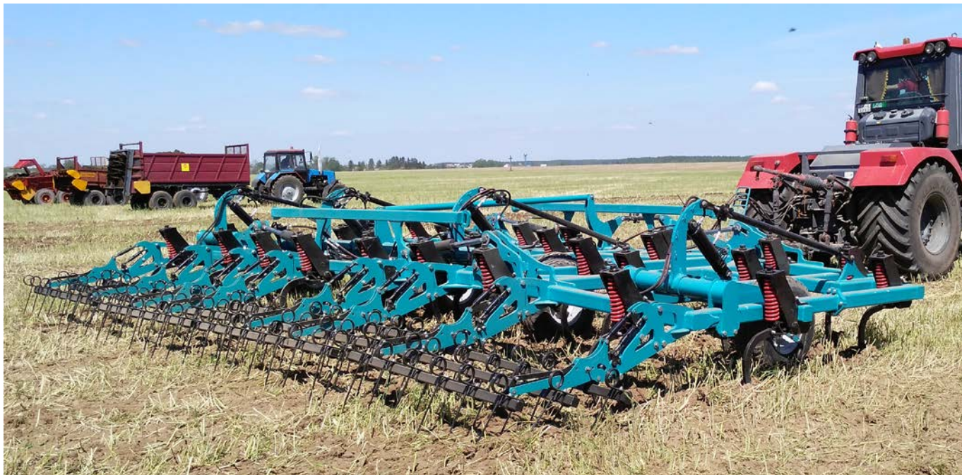
Рабочий орган культиватора